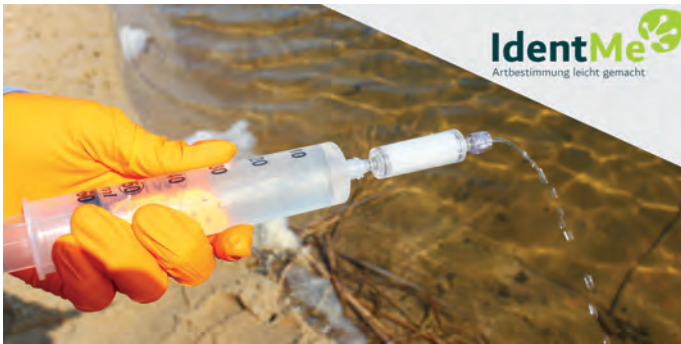
Artenerfassung mittels Umwelt-DNA