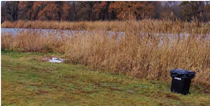
Mülltonnen an unseren Gewässern