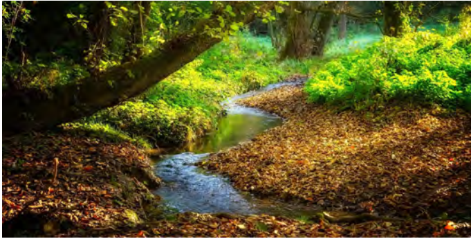
Anpflanzungen zur Beschattung